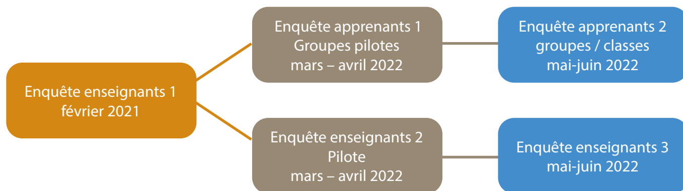
Figure 1 : Calendrier des cinq enquêtes