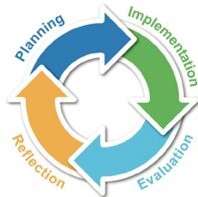
Der Deming-Zyklus der kontinuierlichen Qualitätsverbesserung

unterstützt Lehrkräfte an Schulen und andere Fachkräfte im Bereich des Sprachenlernens bei der Überarbeitung der Lehrpläne in Übereinstimmung mit der Vision des GeRS für Lehren und Lernen. Mit dem handlungsorientierten Ansatz des GeRS werden Planung, Unterricht und Beurteilung integriert, um die Qualität der Sprachbildung zu verbessern.